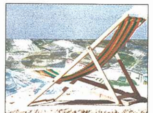
Retraite à 62 ans: quel coût? 4