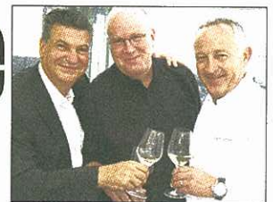
Semaine du Goût: riche programme 3